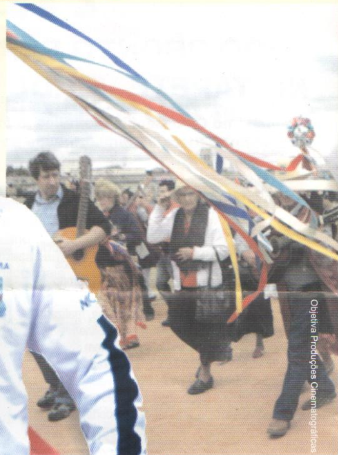
Objetiva Produções Cinematográficas

Os Congadeiros, Foliões do Divino, Catireiros e Moçambiqueiros já sabem: graças a lei 14607/2007 de Juscelino Gadelha, a festa Revelando São Paulo está garantida todo santo ano. Mas o vereador quer mais: já entrou com os papéis e quer o tombamento do encontro organizado pela Abaçai Organização Social de Cultura. Com, isso, ela passa a ser protegida pelo município como um bem valioso. Só que em vez de bem material, um bem imaterial. ■