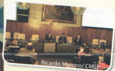
Ricardo Moreno / CMSP

O terceiro seminário foi dividido em duas partes. Na primeira, o Movimento Nossa São Paulo e organizações da sociedade civil e cidadãos apresentaram propostas que podem resultar na redução de até 30% na emissão dos gases (CO) pelos automóveis. O documento propõe que as principais vias da cidade sejam transformadas em corredores de ônibus, que teriam semáforos sincronizados e espaços para ultrapassagem. Outra diretriz sugerida é a descentralização da atividade econômica e do emprego em São Paulo, para que as pessoas possam trabalhar, fazer compras ou usar os serviços públicos sem precisar se deslocar para outras regiões da cidade. Na segunda parte do Seminário, foram exibidos dados da pesquisa Ibope que revelam que 67% dos paulistanos apoiam priorizar o transporte coletivo em São Paulo.